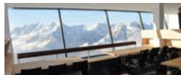
Blick aus dem Panoramarestaurant Richtung Norden

Der Augenschmaus wird durch das Mittagessen, welches einen