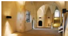
Die gotische Halle von Schloss Landeck

Gerichtsbarkeit und Hexenprozesse, Realteilung und Auswanderung, Jenische und Schwabenkinder. Ein Streifzug durch die bewegte