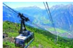
Blick auf Landeck / Zams

In luftiger Höhe angekommen, eröffnet sich ein herrlicher Ausblick in die Gebirgswelt des Alpenhauptkammes.