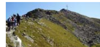
Am Weg zum Gipfelkreuz

AUSSICHT“ , welcher sie direkt vom Panoramarestaurant zu herrlichen Ausblicken führt. Die Dauer des Rundgangs ist ca. 20 Minuten und ist auf Grund seiner Begebenheiten für jeden